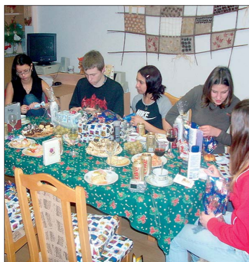
děti vyrůstající v dětském domově

PT Víte, jaké země označujeme jako rozvojové a proč?