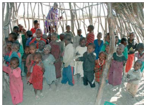
podmínky, v nichž žije řada dětí na celém světě, jsou pro nás často nepředstavitelné

Z Na mapě světa vyhledejte země, které označujeme jako rozvojové.