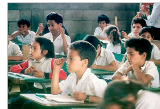
hlavním přínosem projektu „Adopce na dálku“ je umožnit dětem z rozvojových zemí přístup ke vzdělání

V rodině získáváme první ..1.. se vztahy k ostatním lidem. Učíme se v ní rozlišovat co je ..2.. a co ..3.. Rodinné příslušníky zobrazujeme pomocí ..4.. Rodinu, ve které děti žijí společně se svými rodiči, označujeme jako ..5.. Jako užší rodinu označujeme rodinu skládající se z ..6.. Širší rodinu tvoří např. ..7.. V dnešní době za rodinu považujeme i dva lidi, kteří spolu nejsou ..8.. , ale starají se o ..9.. Rodinu může tvořit i jeden ..10.. , který se sám stará o ..11..