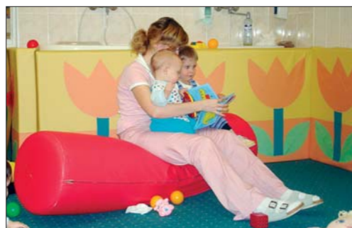
děti v kojeneckém ústavu

Dalším typem náhradní rodinné péče je společenství matky a několika dětí , kteří spolu žijí v SOS dětských vesničkách . Dosud nejrozšířenější formou náhradní péče u nás jsou výchovná zařízení . Pro malé děti to jsou tzv. kojenecké ústavy , pro větší pak dětské domovy . Děti zde žijí ve větších kolektivech a starají se o ně vychovatelé nebo vychovatelky.