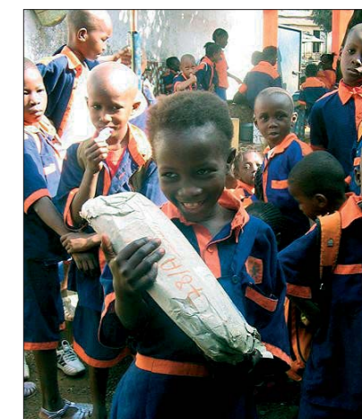
dítě adoptované na dálku s dárky od svých adoptivních rodičů

Rodina je základní skupinou lidí, v níž žijeme. Soužití rodičů s dětmi může mít různé podoby. Rodina může být biologická, adoptivní, pěstounská nebo třeba rodina maminek s dětmi v SOS vesničkách. Některé děti žijí v dětských domovech. Není nejdůležitější, v jakém typu rodiny člověk žije, ale jaké vztahy si v rodině vytváří. V rodině se dítě učí nápodobou dalších členů rodiny a vytváří si schopnost důvěřovat okolnímu světu. Rodina nám dává zázemí a pocit bezpečí.