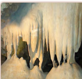
jeskyně Na Pomezí