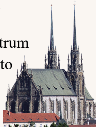
katedrála sv. Petra a Pavla