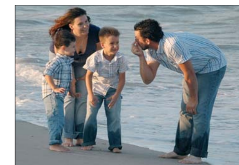
život v pěstounské či adoptivní rodině může být stejně hodnotný jako v rodině biologické, důležitá je vzájemná důvěra a porozumění

Pěstounské rodiny jsou rodiny, které dítě přijaly do výchovy . Pěstounskou péčí nevzniká příbuzenský vztah dítěte s pěstouny. „Náhradní rodiče“ však i v tomto typu rodiny pečují o děti se stejnou láskou a péčí, jako by byly jejich vlastní.