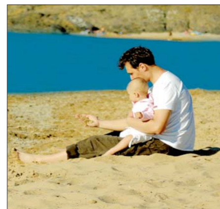
rodinu může tvořit i jeden rodič, který vychovává dítě sám

V současnosti je u nás rodičovství a rodinným vztahům věnována pozornost ze strany státu a rozmanitých sdružení. Existují například programy mateřských center . Jsou to místa, kam mohou chodit matky nebo otcové, kteří jsou na rodičovské dovolené s malými dětmi. Mohou se zde věnovat zajímavým činnostem, jako je cvičení, plavání s dětmi, výtvarná tvorba apod.